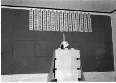
写真① 内禁 神将位目と祭壇