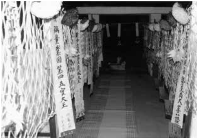
写真⑧ 霊をあの世界に導く道

力により防ごうという信仰から禁忌祓浄の場に用いられることが多い (47) 。蝶は喜びの象徴であり、夏を象徴し、また夫婦の琴瑟のよさを象徴した (48) のでその姿の華麗さとともに女性の装飾品に今日も多く使われている。ホトトギスの鳴き声は怨み