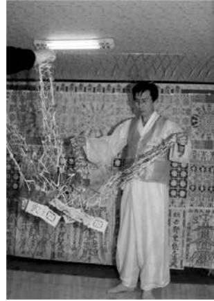
写真③ 設経 鉄網

をも表わす。心は個人の内に固有に存在するが、それが民族や時代の傾向を集め、人間として生きる決意と方向性をもつときに、人間精神を形づくっていく。そして人間精神は、時代や状況と対応する文化をつくりあげていくのである (36) 。」形は人の心を表わすものであるだけでなく、それは人の精神や文化をも映しだし、時には、民族や時代の特徴も映しだす。設経図に多く円中央陣が使われるのは、円が「人間の根源的なもの、あるいは人間の誕生以前の神や宇宙を含めた元